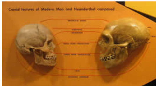
現代人（左）とネアンデルタール人（右）の比較

ネアンデルタール人は現代人と違う特徴を持っていますが、似ているところもたくさんあります。トーマス・ハクスレーをはじめとする 19 世紀の進化論研究者の中でも、ネアンデルタール人は人間と同じであるという主張がなされていました。